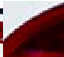
Detalj av samma bild kraftigt förstord, här syns pixlarna tydligt.