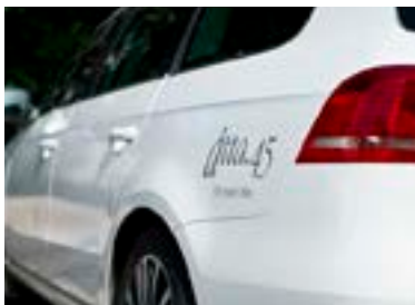
300 dpi i verklig storlek (100%)

För tryck på stortavlor, rolluper och stora skyltar räcker det oftast med 100 dpi i skala 1:1 om bilden är av bra kvalitet.